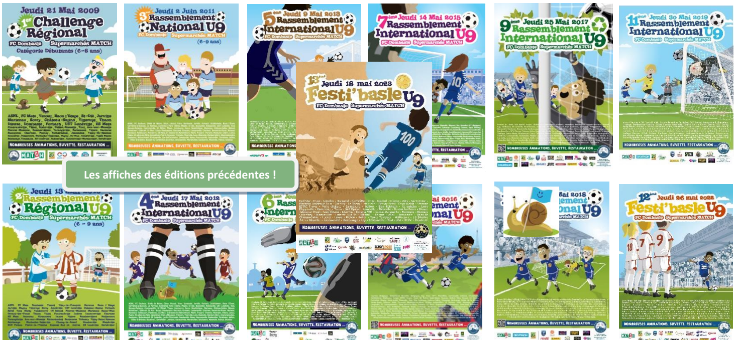
Les affiches des éditions précédentes !