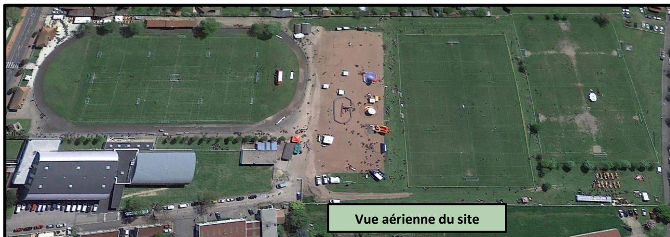
Vue aérienne du site